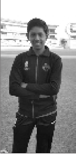
ચિ. પુરવ પરીખ