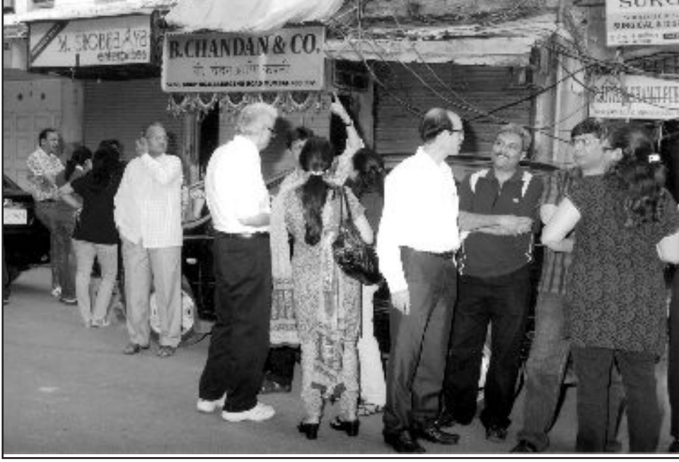
કાર ટ્રેઝર હંટમાં ભાગ લેનાર પ્રતિસ્પર્ધીઓ તથા અન્યો