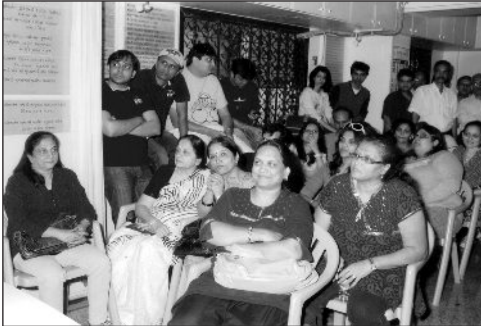
કાર ટ્રેઝર હંટમાં ભાગ લેનાર પ્રતિસ્પર્ધીઓ તથા અન્યો