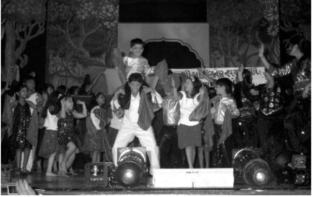
પલમાં વાર્ષિક રસોત્સવની ઝલક